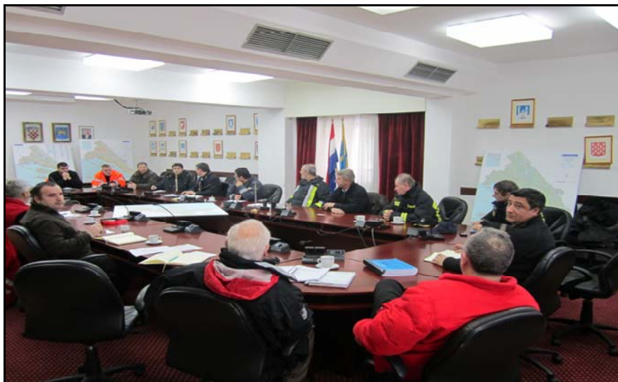
Slika 2. Sjednica Stožera zaštite i spašavanja Splitsko-dalmatinske županije 04. veljače 2012.

Četvrti veljače na sjednici Stožera nazočio je i ministar unutarnjih poslova gdn. Ranko Ostojić, što se može vidjeti na slici br.2.