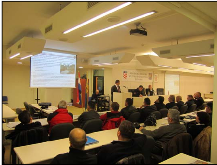
Slika 3. Raščlamba Izvješća o snježnoj nepogodi.